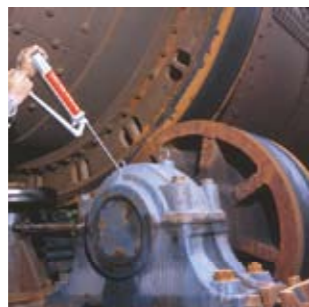
▲로터리 킬른의 베어링에. (시멘트 공장)