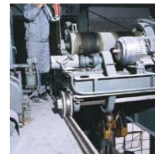
▲공장설비 기계 유종 통일에.