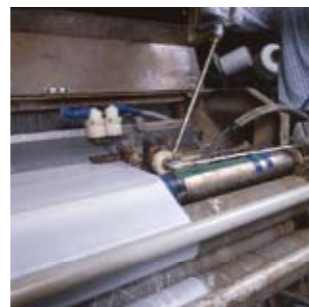
▲물과 접촉하는 기계에. (워터 제트의 베어링)