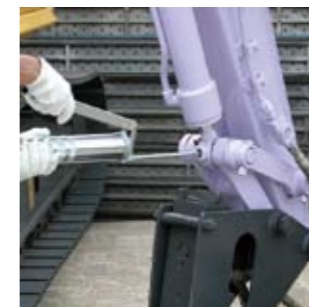
▲건설 기계 유종 통일에.