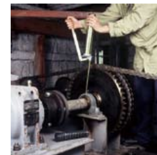
▲설비 기계의 베어링에.