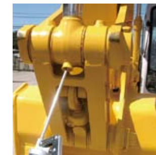
▲건설 기계 핀에.