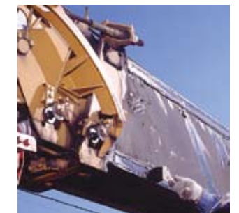
▲물과 접촉하는 접동부에. (Moly HD Grease)